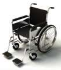
การรับการดูแลเป็นพิเศษ

กรณีผู้เดินทางต้องการความช่วยเหลือเป็นพิเศษ อาทิเช่น การใช้วีลแชร์ กรุณาแจ้งบริษัทฯ อย่างน้อย 7 วันก่อนการเดินทาง มิฉะนั้นบริษัทฯ จะไม่สามารถจัดการล่วงหน้าได้ เนื่องจากการขอใช้วีลแชร์ในสนามบินนั้น ต้องมีขั้นตอนในการขอล่วงหน้า และบางสายการบินอาจมีการเรียกเก็บค่าใช้จ่ายทั้งทางสนามบิน ในไทยและในต่างประเทศ ซึ่งผู้เดินทางสามารถสอบถามกับเจ้าหน้าที่ได้โดยตรงก่อนทำการจอง และหากใน ขณะของท่านมีผู้ต้องการดูแลพิเศษ เช่น ผู้ที่นั่งรถเข็น (Wheelchair), เด็ก, ผู้สูงอายุและผู้ที่มีโรคประจำตัว หรือไม่สะดวกในการเดินทางท่องเที่ยวในระยะเวลาเกินกว่า 4 - 5 ชั่วโมงติดต่อกัน ท่านและครอบครัวต้อง ให้การดูแลสมาชิกภายในครอบครัวของตนเอง เนื่องจากการเดินทางเป็นหมู่คณะ หัวหน้าทัวร์มีความ จำเป็นต้องดูแลคณะทัวร์ทั้งหมด