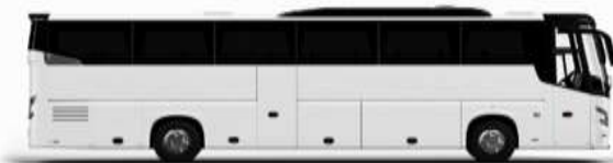
ตัวอย่างรูปภาพรถ 1 คัน

ค่าที่พักตามที่ระบุในรายการหรือเทียบเท่าระดับเดียวกัน (พักห้องละ 2 ท่าน) หากประเภทห้องที่ท่านริเคอสมาดำเนินการ เช่น ริเคอสห้องพักเป็น TWIN BED หรือ DOUBLE BED ทางบริษัทขอสงวนสิทธิ์ในการปรับประเภทห้องพัก เป็นตามที่โรงแรมมีอยู่ โดยไม่ต้องแจ้งให้ทราบล่วงหน้า