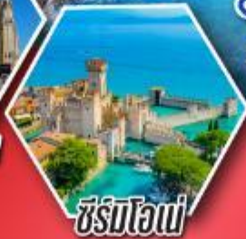
ซีร์มิโอเน่