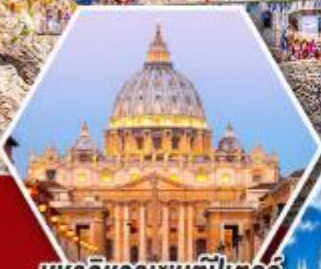
มหาวิหารเซนต์ปีเตอร์