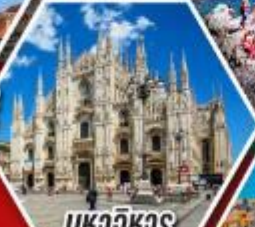
มหาวิหาร ดูโอโมแห่งมิลาน