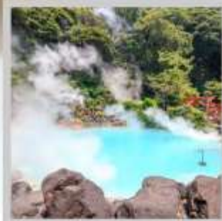
“BEPPU UMI JIGOKU”