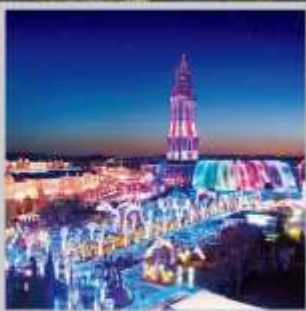
“HUIS TEN BOSCH”