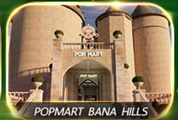
POPMART BANA HILLS

สัมผัสความงามหมู่บ้านฝรั่งเศสที่บานาฮิลล์ ช้อปปิ้ง POPMART เยือนเมืองโบราณฮอยอัน ล่องเรือกระดิง วัดหลินอึ้ง สะพานมังกร