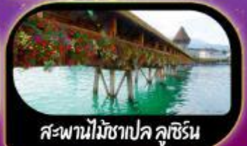
สะพานไม้ซาเปล ลูซิริน