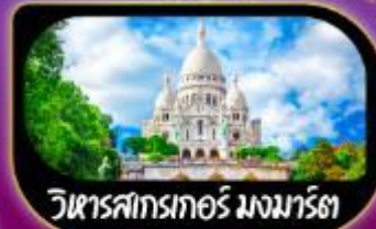
วิหารสกรทอร์ มงมาร์ต