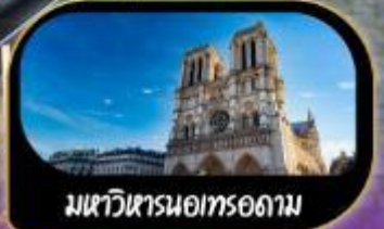
มหาวิหารนอทรอดาม