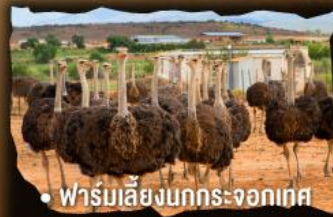
• ฟาร์มเลี้ยงนกกระจอกเทศ