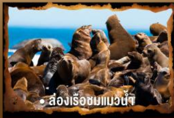
• ส่องเรือชมแมวน้ำ

ชมสัตว์ป่าน้อยใหญ่นานาชนิดระหว่างกิจกรรมส่องสัตว์ยามค่ำคืน