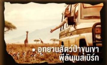
• อุทยานสัตว์ป่าขุนเขา ฟลินนสเบิร์ก