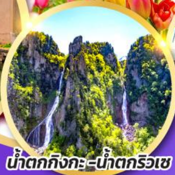
น้ำตกกิ่งกะ-น้ำตกริวเซ