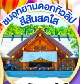
ชมอุทยานดอกทิวลิป สีสันสดใส