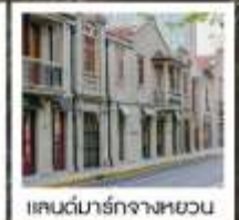
แลนด์มาร์กจางหยวน

เซี่ยงไฮ้ คคลาสสิก ไนท์ / 3 ดึกใหญ่แห่งเซี่ยงไฮ้ คองเรือหมู่บ้านโบราณจูเจียเจียว / EKA Tianwu / วัดหลงหัว แลนด์มาร์ก จางหยวน / ถนนหวยไห่ / ชมโชว์ ERA ที่โรงละครโด่งดังระดับโลก / ซินเทียนตี้