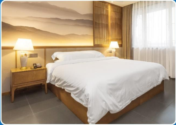
👤 SINGLE (SGL)