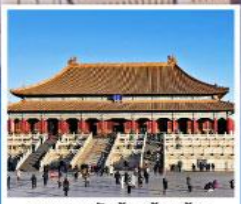
พระราชวังต้องห้ามปักกิ่ง