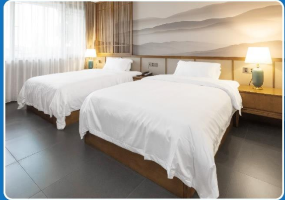
👤👤 TWIN (TWN)