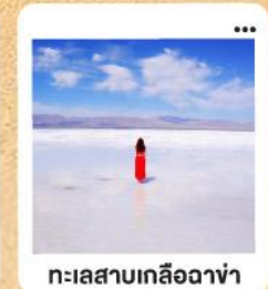
ทะเลสาบเกลือฉาซ่า