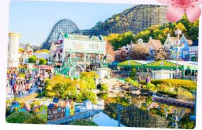
เอเวอร์แลนด์