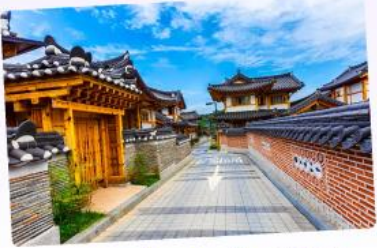
หมู่บ้านโบราณอินพยอง