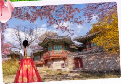
พระราชวังชางด็อกกุง