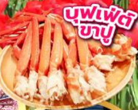
บุฟเฟ่ต์ ขาปู