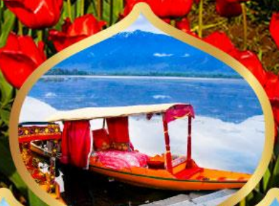
ล่องเรือชิคาร่า