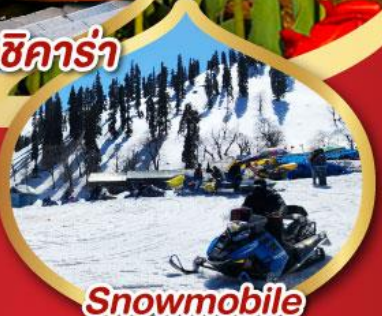
Snowmobile วิวเทากุลมาร์ค ราคาเริ่มต้น