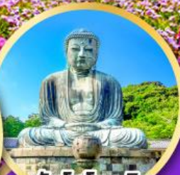
วัดโคโตคุอิน