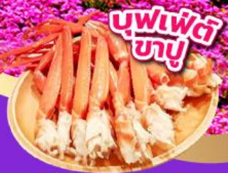
บุฟเฟ่ต์ ภูเขา