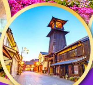
หอรบั้งโทคิโนะคาเนะ