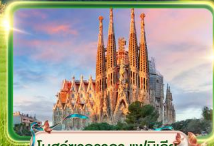
โบสถ์ซากราดา แฟมิลีย