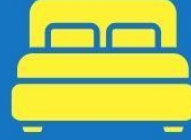
ห้องพักดับเบิล DOUBLE