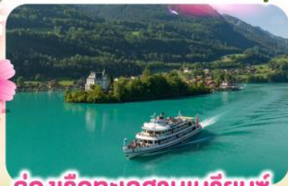
ล่องเรือทะเลสาบเบรียนซ์

พิชิตยอดเขาชุนเนกกา 1 ในเขาที่สวยงามที่สุดเมืองเซอร์แมท