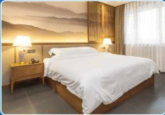
👤 SINGLE (SGL)