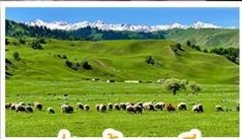
ทุ่งหญ้าานาลาถิ