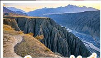
แกรนด์แคนยอนตู่ชานจื่อ