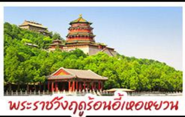
พระราชวังฤดูร้อนอี้ทงหยวน

มือพิเศษ เปิดปิกกิ้ง สุกี้มองโก MICHELIN GUIDE ร้าน TAO TAO JU