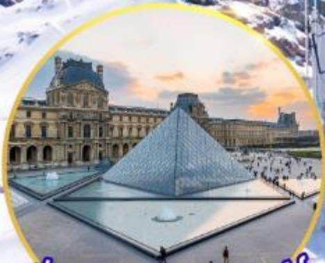
ถ่ายรูปคู่พีระมิดที่ลูฟร์