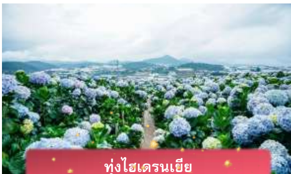
ทุ่งไฮเดรนเยีย

นำท่านเล่น นั่งโรลเลอร์โคสเตอร์ ชมธรรมชาติท่ามกลางป่าสนไปยัง น้ำตกตาดันลา สัมผัสอากาศบริสุทธิ์และบรรยากาศสดชื่น พร้อมจิบเครื่องดื่มชม วิวธรรมชาติ นำท่านเดินทางสู่ ทุ่งไฮเดรนเยีย อีกหนึ่งทุ่งดอกไม้ ที่ไม่ควรพลาดมาถ่ายรูปกัน ข้อดีของที่นี่ คือ ดอกไม้จะบานตลอดทั้งปี