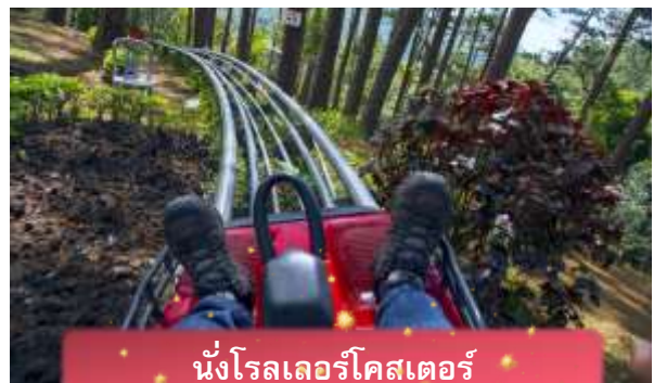
นั่งโรลเลอร์โคสเตอร์