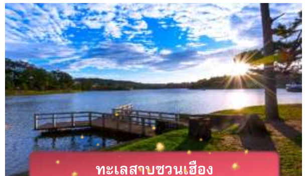
ทะเลสาบชวนเอื้อง

ที่พัก The Western Hill ระดับ 4 ดาวหรือเทียบเท่า