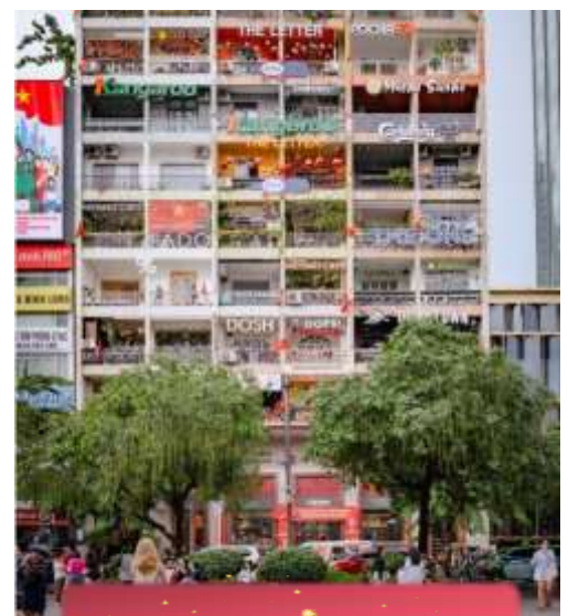
The Cafe Apartment.

ที่พัก Sai Gon Emerald ระดับ 4 ดาวท้องถิ่นหรือเทียบเท่า