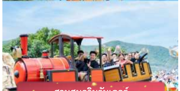
สวนสนุกวินวันเดอร์