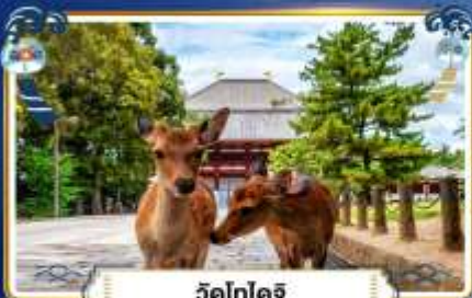
วัดโทไดจิ