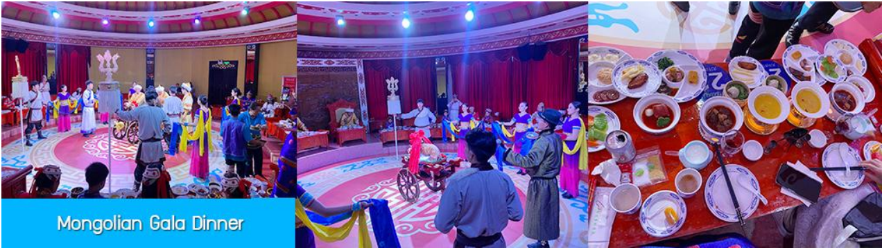
Mongolian Gala Dinner