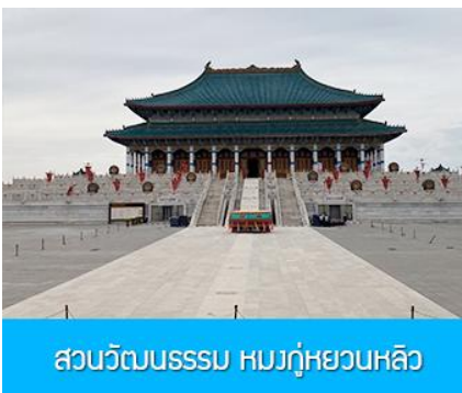
สวนวัฒนธรรม หมงกู่หยวนหลิว

หลังอาหารนำท่าน เที่ยวชม จวนอ๋องจวินหวัง 郡王府 จวนแห่งนี้เริ่มสร้างขึ้นในปี ค.ศ. 1902 สร้างเสร็จในปี ค.ศ. 1936 เป็นที่พำนักของ อ๋องอิฉิจวินหวัง 伊旗郡王 เป็นจวนอ๋องเพียงหนึ่งเดียวที่ได้รับการอนุรักษ์ในสภาพที่สมบูรณ์ โครงสร้างทำด้วยอิฐ หิน และไม้ ประกอบด้วยห้องพัก 16 ห้อง เป็นสถาปัตยกรรมผสมแบบมองโกล ทิเบต และฮั่น