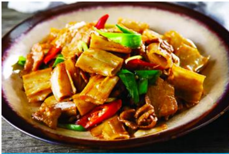
ถนนคนเดินเออร์ดอส

ยิ่งใหญ่เมื่อ 700 ปีก่อน ชม ประตูงเทียน 崇天门 สุคมโหฬารที่แสดงถึงความยิ่งใหญ่ของจักรวรรดิมองโกล ชม จัตุรัสเถิงเก้อหลี่ 腾格里广场 จัตุรัสกลางแจ้งขนาดใหญ่ที่ใช้ประกอบพิธีกรรมต่าง ๆ