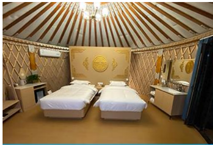
ห้องพักสไตล์มอโกเลียน