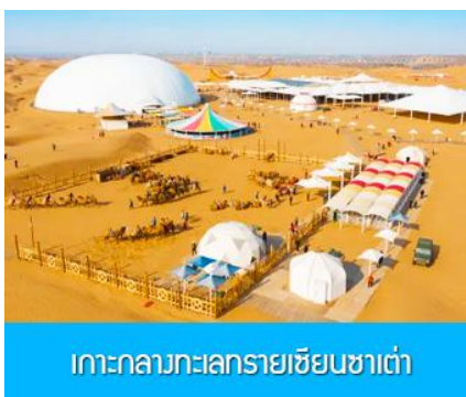
เกาะกลางทะเลทรายเซียนซาเต๋า