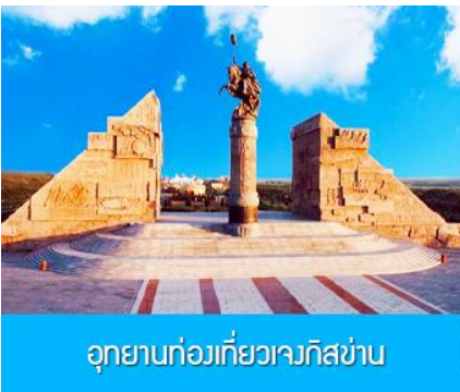
อุทยานก่อกว่ยเวงกิสข่าน