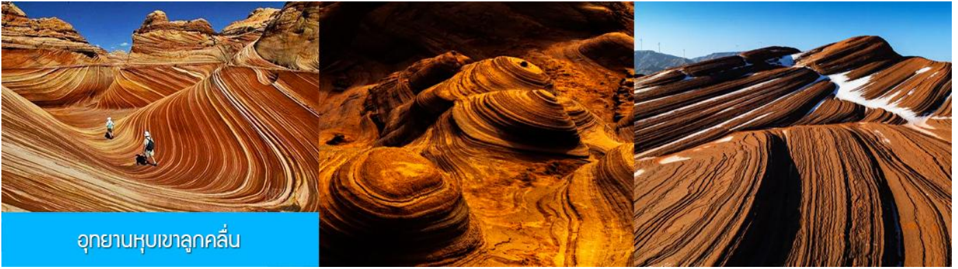
อุทยานหุบเขาลูกคลื่น