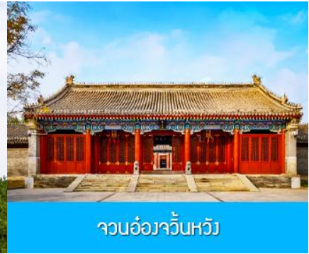
จวนอ๋องจวินหวัง

วันที่หก เมืองเออร์ดอส-อี้เค้อเอ้าเป่า-จวนอ๋องจวินหวัง- สวนวัฒนธรรมหมงกู่หยวนหลิว-ซื้อปิ้งถนคนเดิน