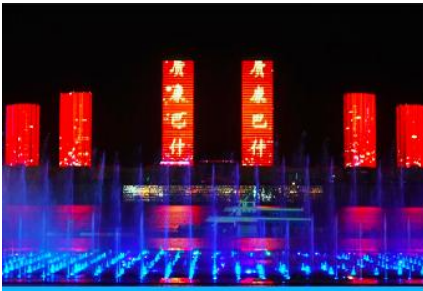
น้ำพุดนตรีคังปาสือ