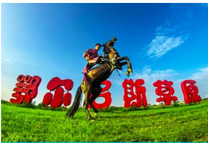
ทุ่งหญ้า เออร์ดอส

พักที่ ORDOS BOYU AIRUI HOTEL โรงแรมระดับ 4 ดาวท้องถิ่น หรือเทียบเท่าในเมืองเออร์ดอส