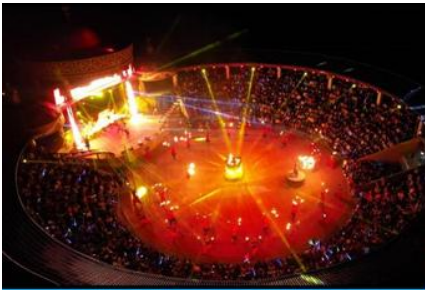
ปาร์ตี้กองไฟยามค่ำ