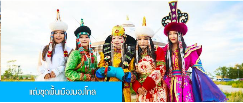
แต่งชุดพื้นเมืองมองโกล