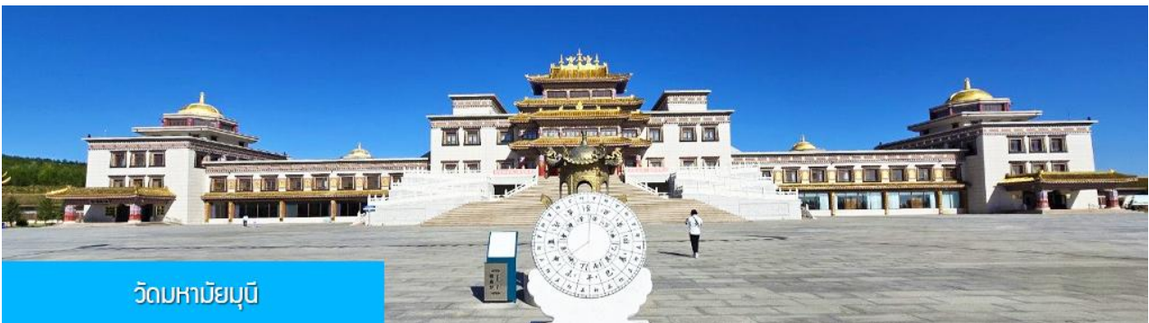
วัดหามัยมุนี

พักที่ YULIN CHAOYANG INTER HOTEL โรงแรมระดับ 4 ดาวท้องถิ่น หรือเทียบเท่าในเมืองหยี่หลิน