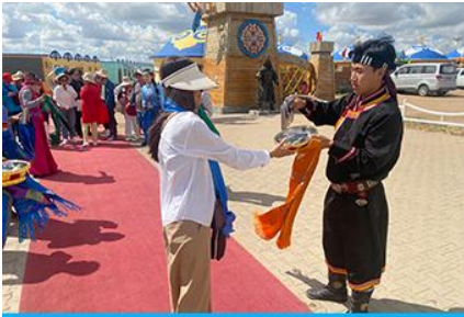
พิธีต้อนรับแขกด้วยเหล้า