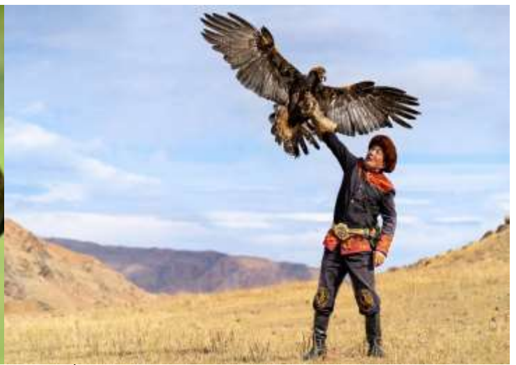
อินไตยาก

จากนั้นนำท่านเดินทางต่อไปยังที่พัก อิสระให้ทุกท่านได้ถ่ายรูปกับ Yurt ตามอัธยาศัย