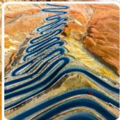
ถนนผานหลงกู่ต้าอว