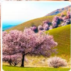
ทุ่งดอกอัลมอนต์