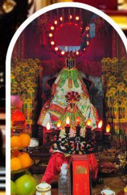
วัดเจ้าแม่กวนอิมอ่องฮำ ขอพรเรื่องเงิน ทรัพย์สิน และความมั่งคั่ง