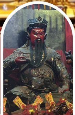
วัดกวนไท่ ขอเทพเจ้ากวนอู ความซื่อสัตย์ เงินทอง ธุรกิจมั่นคง