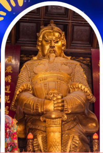
วัดแซกง ขอพรโชคกลาง การเงิน และธุรกิจ