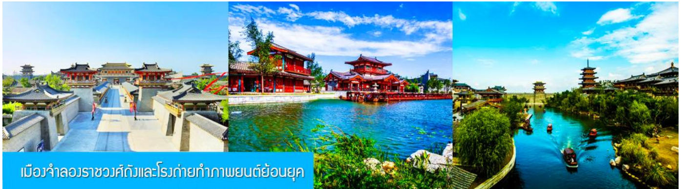
เมืองจำลองราชวงศ์ถังและโรงถ่ายทำภาพยนตร์ย้อนยุค