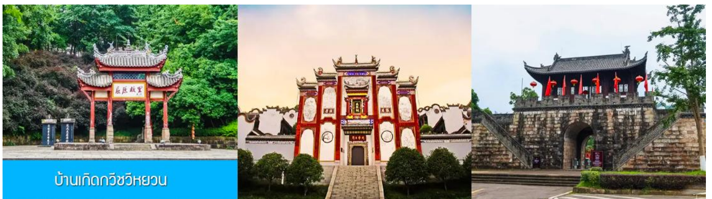
บ้านเกิดกวีชวีหยวน

พักที่ HONG QIAO HOTEL โรงแรมระดับ 4 ดาวหรือเทียบเท่าในเมืองหยีซัง