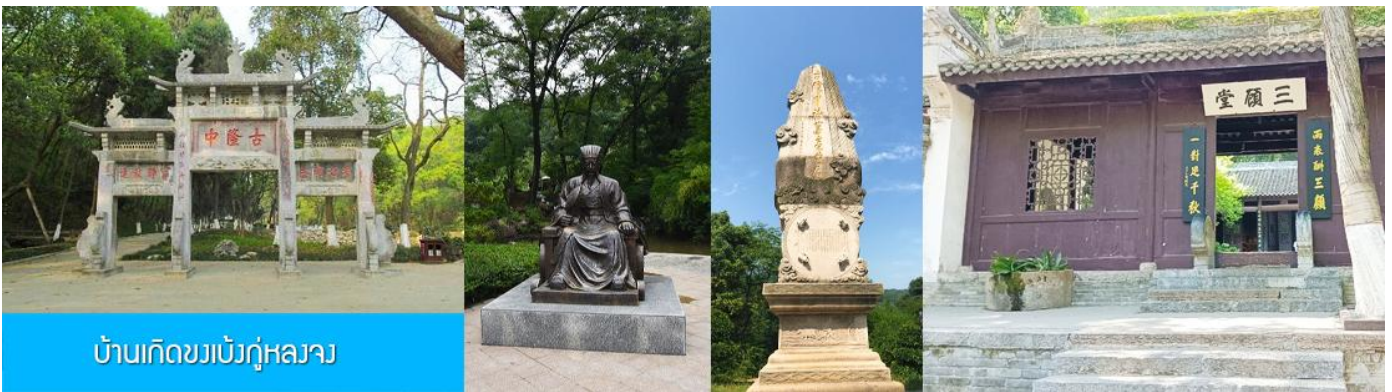
บ้านเกิดขงเบ้งกู่หลงจาง

พักที่ XIANGYANG MEIHAO HOTEL ระดับ 4 ดาวท้องถิ่นหรือเทียบเท่าในเมืองเซียงหยาง