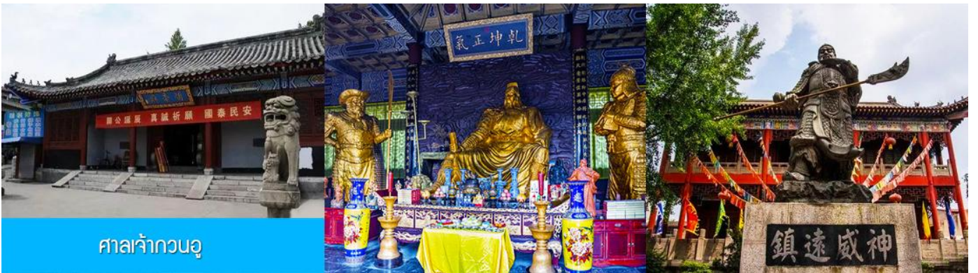
ศาลเจ้ากวนอู