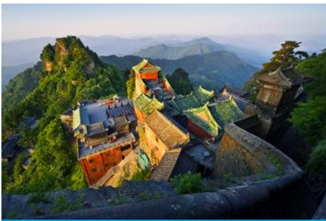
กระเช้าขึ้นเขาบู๊ตึง