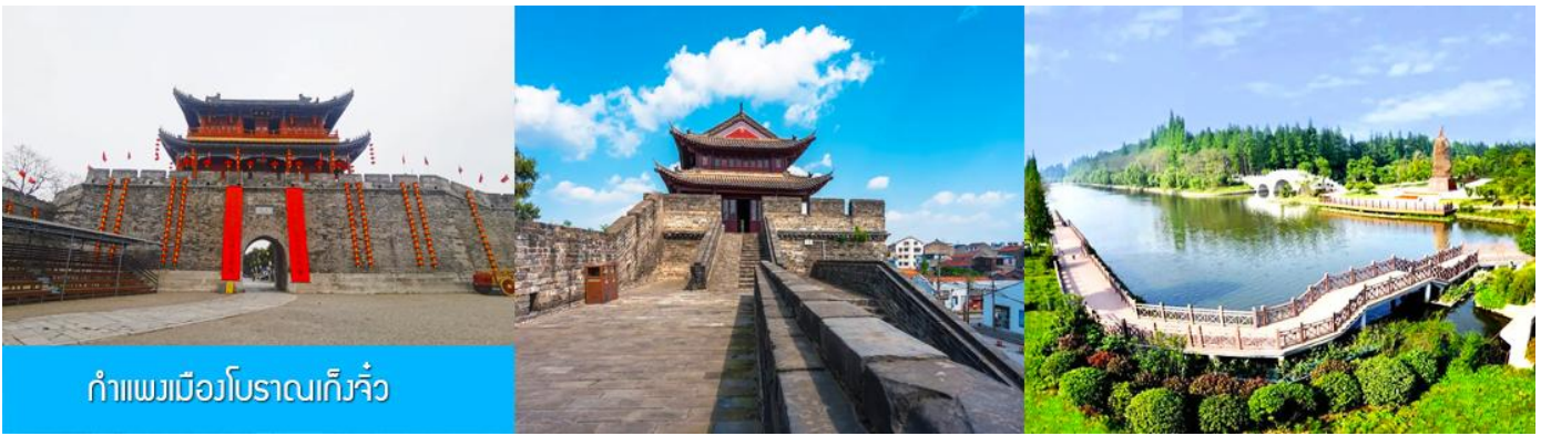
กำแพงเมืองโบราณเกิ่งจิว