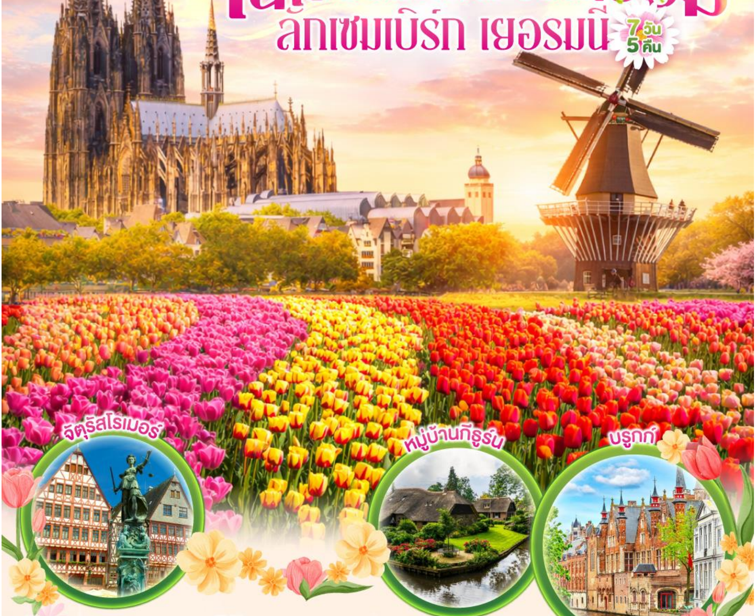
จัตุรัสโรเมอร์