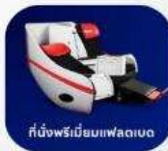
ที่นั่งพรีเมียมแฟลทเบด

บริการอาหารร้อน และ น้ำดื่ม บนเครื่อง ขาไป และ ขากลับ