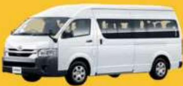
VAN (2-8 ท่าน)