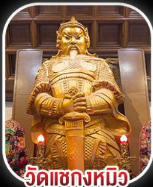
วัดเขกหงหมีว

สวนสนุก CHIMELONG SPACESHIP PARK เจ้าแม่กวนอิมรีพลีสมาธ - เจ้าแม่กวนอิมฮ่องฮำ วัดเขกหงหมีว - พระใหญ่องปิง+กระเช้า เมนูสุดพิศษ!! เป้าฮ้อ+ไวน์แดง , ห่านฮ่าง