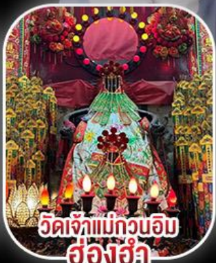
วัดเจ้าแม่กวนอิม ฮ่องฮำ