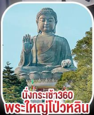
นั่งกระเช้า360 พระใหญ่โป้วหลิน