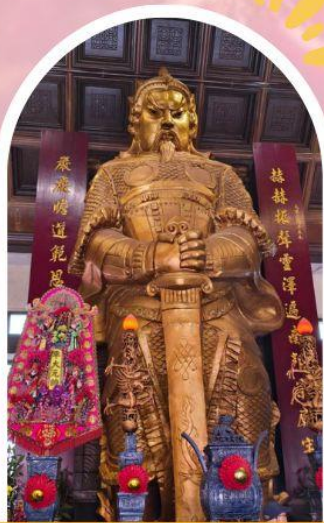
วัดแซกง ขอพรโชคกลาง การเงิน และธุรกิจ