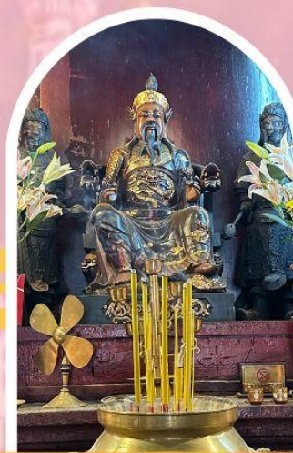
วัดปักไต้ฮ่องกง