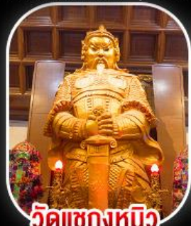
วัดเขกหมิว

วัดเขกหมิว- วัดเจ้าแม่กวนอิมฮ่องกง พระใหญ่ไ่่วหลิน + กระเช้าแองปัง เมนูสุดพิเศษ!! ต้มข้าวฮ่องกง บุฟเฟ่ต์ชาบูสไตล์ฮ่องกง และห่านย่าง อิสระท่องเที่ยวดิสนีย์แลนด์ 1 วัน เลือกซื้อบัตรดิสนีย์แลนด์หรือช้อปปิ้งจุใจ