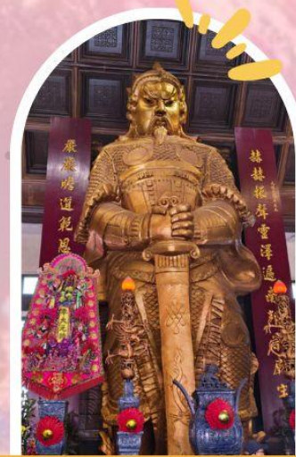
วัดแซกง ขอพรโชคลาก การเงิน และธุรกิจ