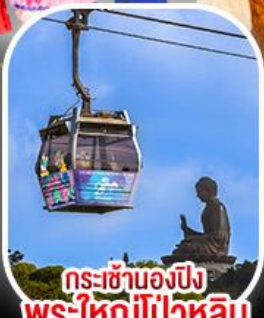
กระเช้าแองปัง พระใหญ่ไ่่วหลิน