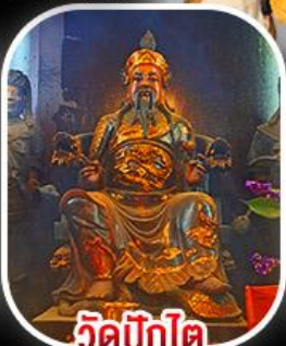
วัดบิกโต