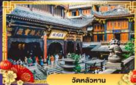
วัดหลัวหนาน