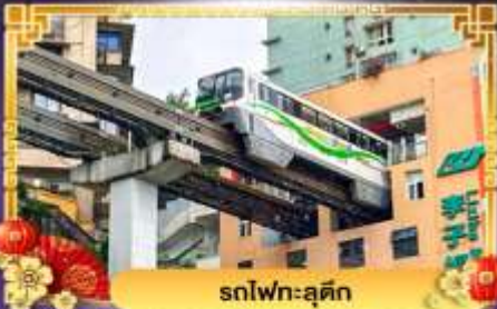
รถไฟฟ้า-ลูตึก