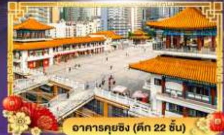
อาคารคุยซิง (ตึก 22 ชั้น)