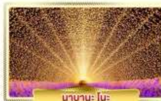
นานานะ โนะ