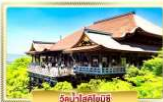
วัดน้ำใสคิโยมิสึ