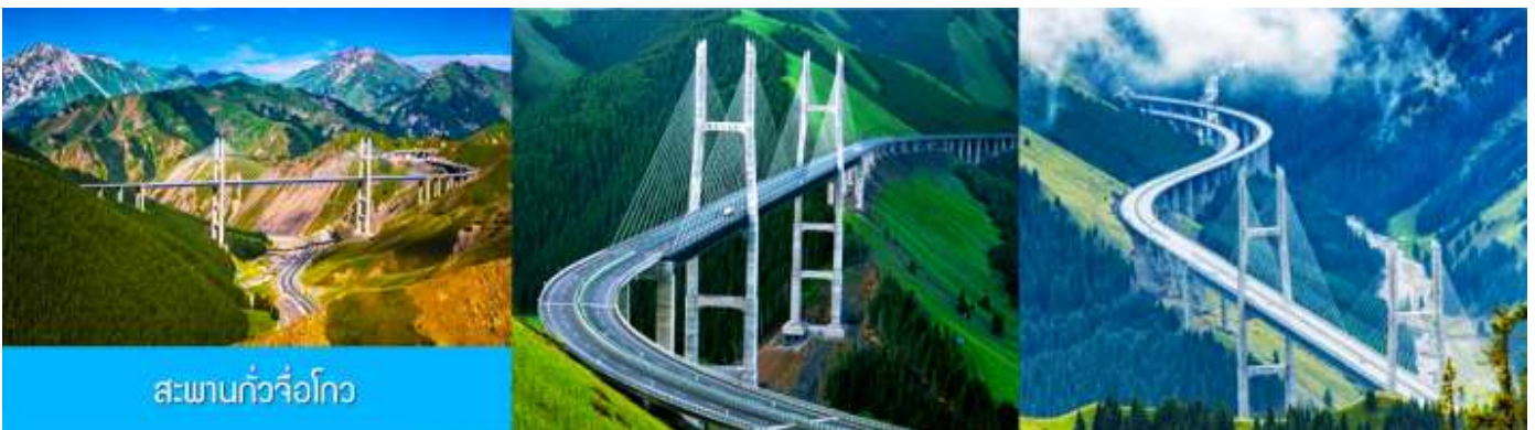
สะพานกั๋วจื่อโกว

หลังอาหารนำท่านเดินทางโดยรถบัสสู่ ตำบลนำลาตี 那拉提 (ระยะทาง 300 กม. ใช้เวลาเดินทางราว 4 ชั่วโมง)