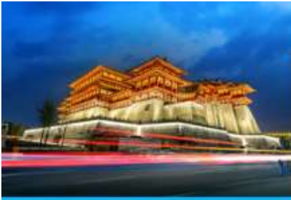
นครฉว๋หยาง