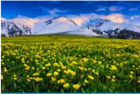
ทุ่งหญ้าลวยฟ้านาลาติ

พักที่ WAN SEN HOTEL ระดับ 4 ดาวท้องถิ่นในตำบลนาลาติ