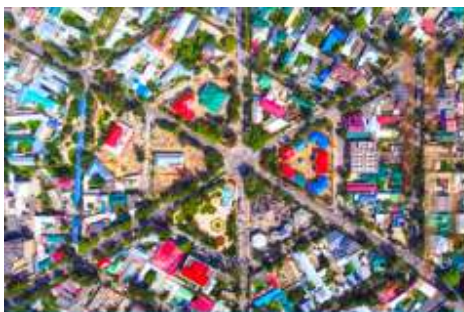
ถนนหกดอก

จากนั้นนำท่านเดินทางสู่ เมืองอิหนิง 伊宁 (ระยะทาง 200 กม. ใช้เวลาเดินทางราว 3 ชั่วโมง)