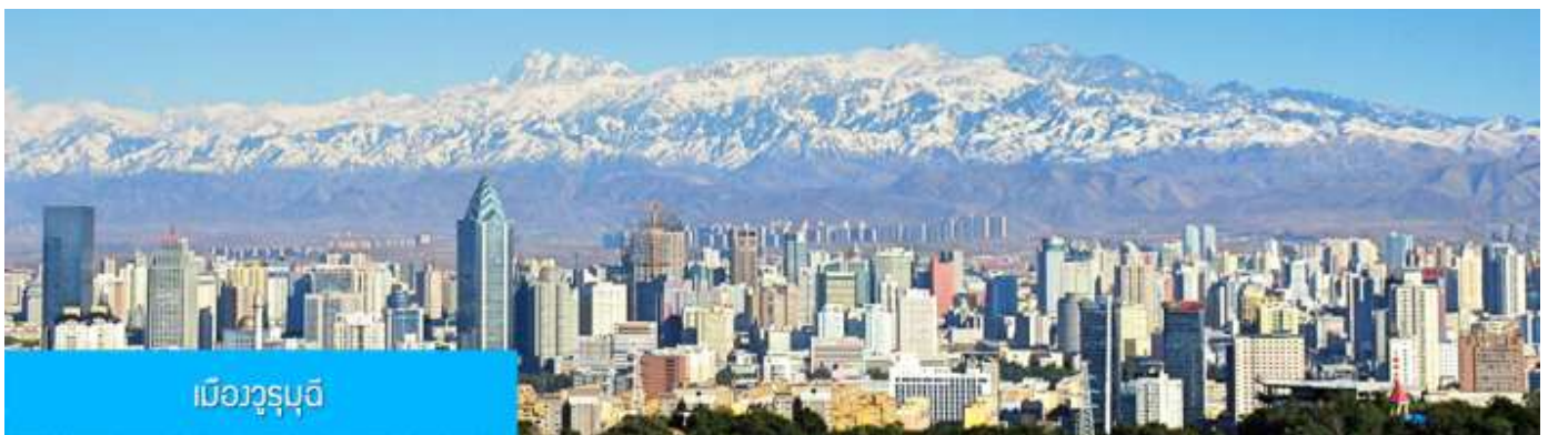
เมืองูรูมูฉี