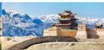
กำแพงเมืองจีน ด้านเจียอวี๋กวน

*ทางบริษัทฯ ขอสงวนสิทธิ์ในการสลับโปรแกรมทัวร์ตามความเหมาะสมขึ้นอยู่กับสถานการณ์หน่วยงาน โดยคำนึงถึงผลประโยชน์ของลูกค้าเป็นสำคัญ