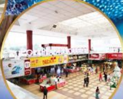
ตลาดกังเป๋ย