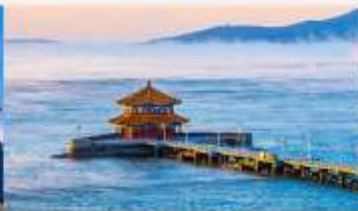
สะพานจันเจียว