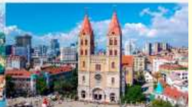
โบสถ์คริสต์เซนต์ไมเคิล

*ทางบริษัทฯ ขอสงวนสิทธิ์ในการสลับโปรแกรมทัวร์ตามความเหมาะสมขึ้นอยู่กับสถานการณ์หน้างาน โดยคำนึงถึงผลประโยชน์ของลูกค้าเป็นสำคัญ