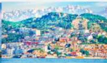
หมู่บ้านชาวประมงซาจื่อโซ่ว