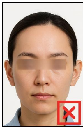
รูปที่ไม่ได้ขนาด ตามที่สถานทูตกำหนด