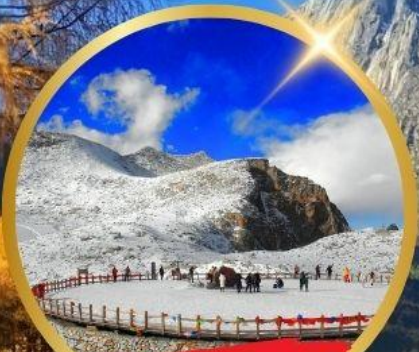
OPTIONAL TOUR ธารน้ำแข็งท่ากู่ปิงชวณ