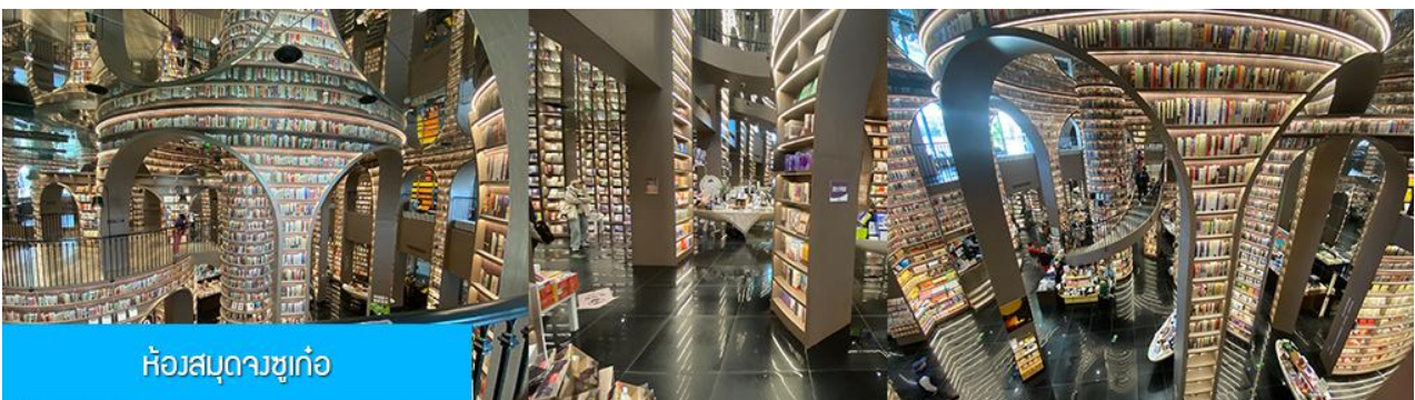
ห้องสมุดจวงชู่เก๋อ

พักที่ โรงแรม MINGZHISHANGCHUN HOTEL ระดับ 4 ดาวท้องถิ่นหรือเทียบเท่าในเมืองคูเจียงเขียน