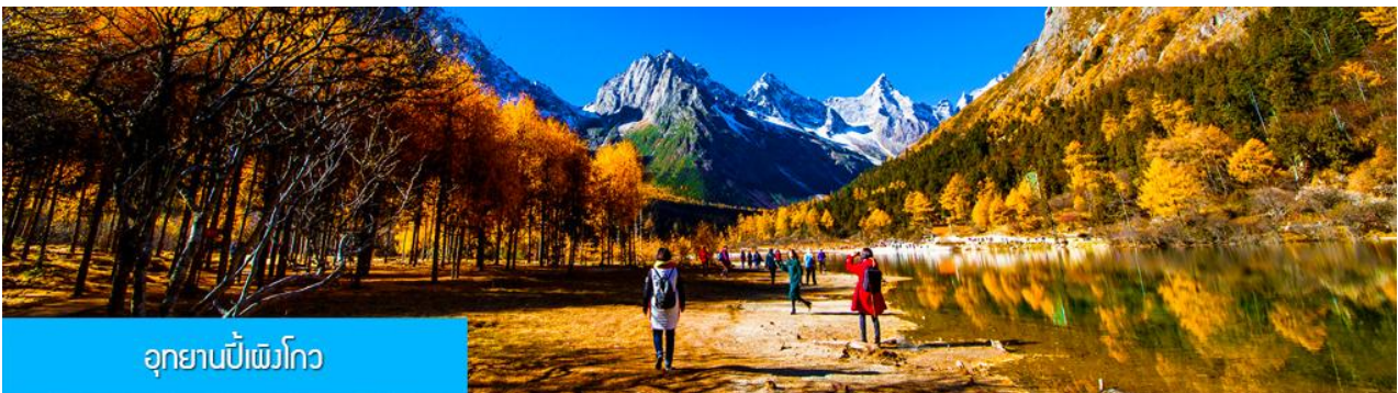
อุทยานเป่ย์เฟิงโกว