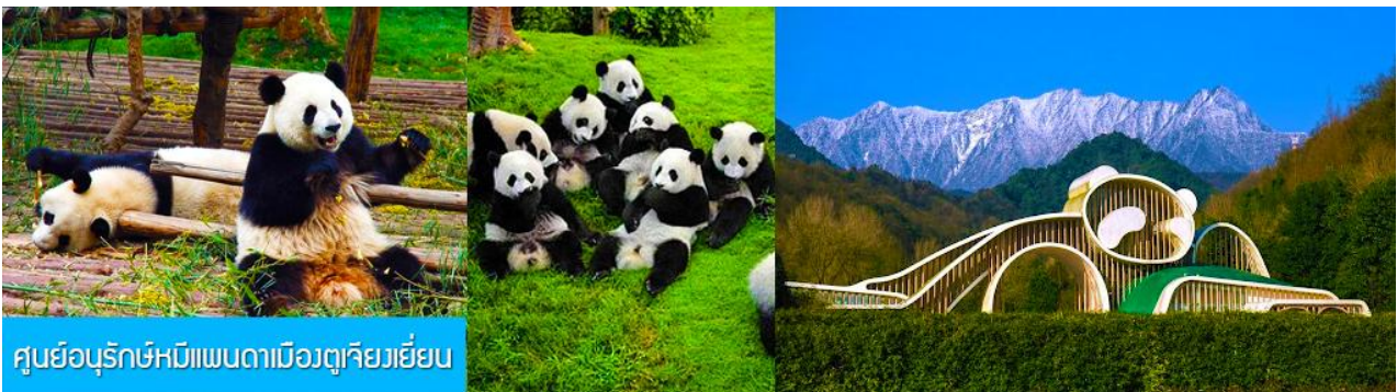
ศูนย์อนุรักษ์หมีแพนดามีอวตูกุเจียงเขียน