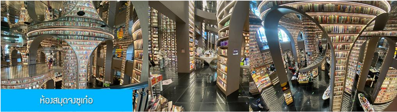
ห้องสมุดจชู่เก๋อ

พักที่ โรงแรม MINGZHISHANGCHUN HOTEL ระดับ 4 ดาวท้องถิ่นหรือเทียบเท่าในเมืองคูเจียงเยียน