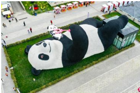
ตุ๊กตหมีแพนด้าเซลฟี