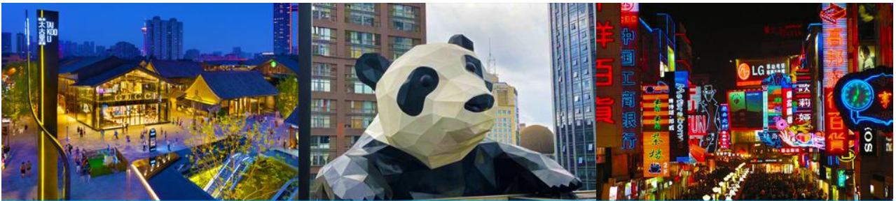
ถนนไท่กุ่หลี่ และวัดต้าเจี๊อ