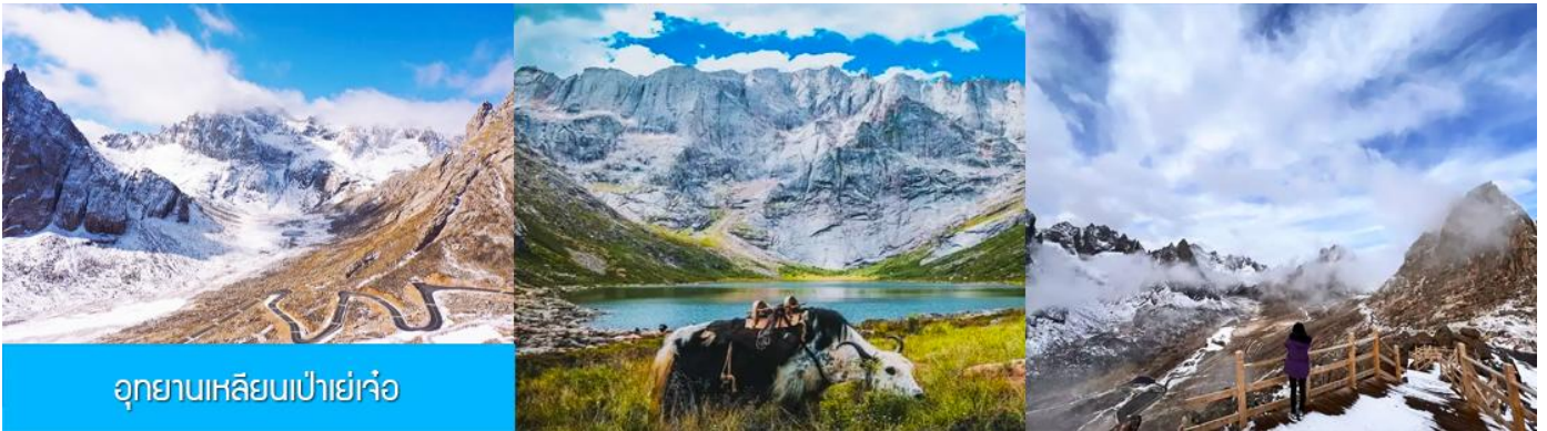
อุทยานเขลิยนเป่าเย่เจ้อ

พักที่ โรงแรม ZUNGE ZHUOYUE HOTEL ระดับ 4 ดาวท้องถิ่นหรือเทียบเท่าในอำเภออาป้า