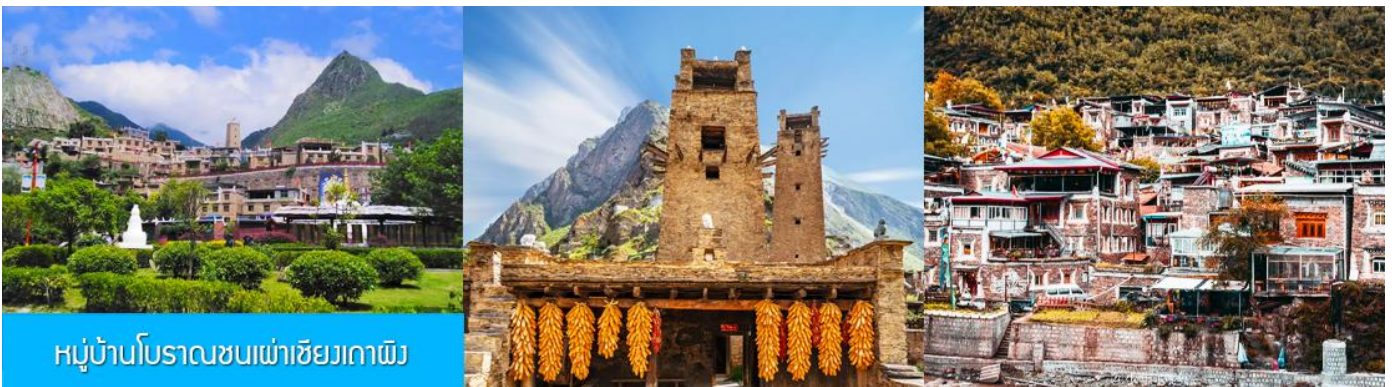
หมู่บ้านโบราณชนเผ่าเซียงเถาผิง