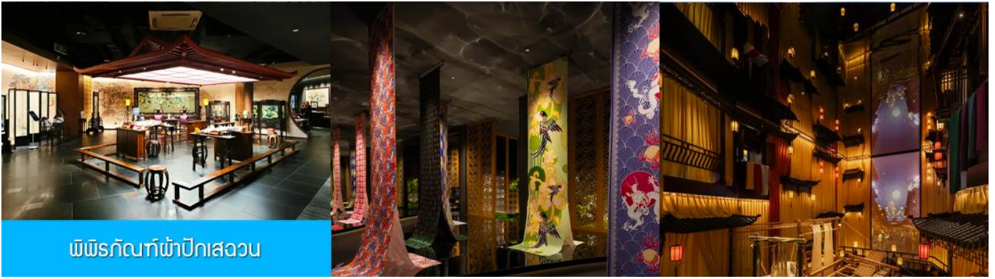
พิพิธภัณฑ์ผ้าปักสวน