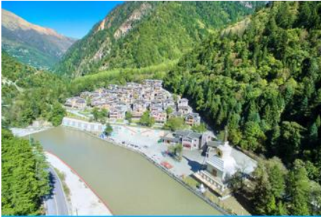
หมู่บ้านทิเบตหยิงหวงฮาเต๋อ

รับประทานอาหารกลางวัน ณ ร้านอาหารพื้นเมือง (8)