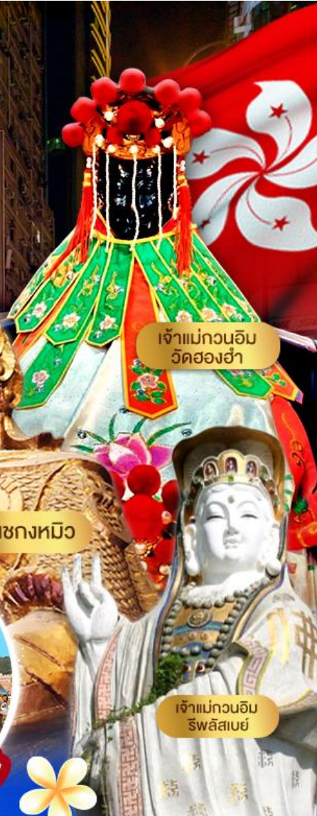
เจ้าแม่กวนอิม วัดสอง丫

เลือกซื้อ Option Disneyland กระเช้ามองปิง 360