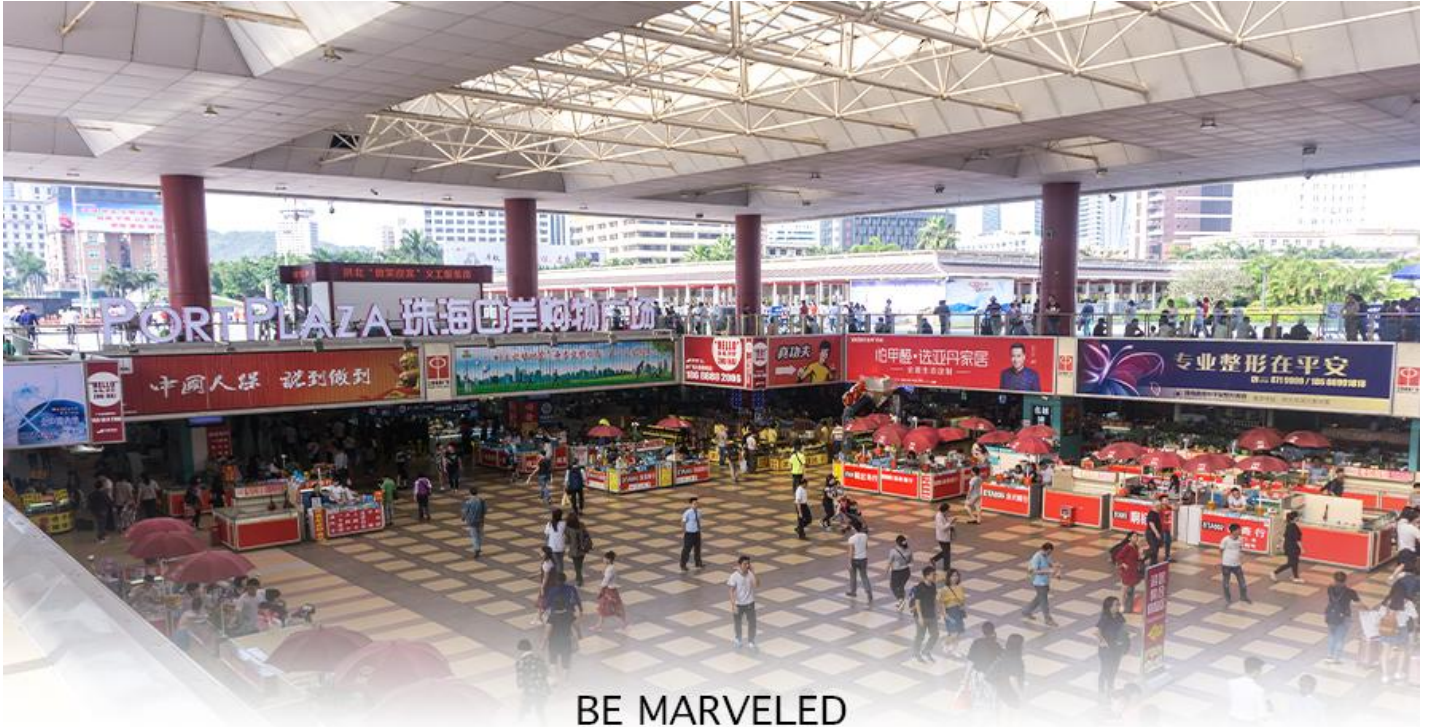
BE MARVELED ตลาดใต้ดิน กวเป่ย์

☉ อีศระอาหารอาหารเย็นตามอัธยาศัย **เพื่อความสะดวกในการซื้อปิ้ง**