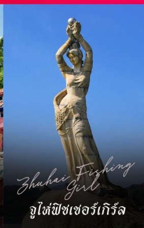
Zhuhai Fishing Girl จูไห่ฟิชเชอร์เกิร์ล