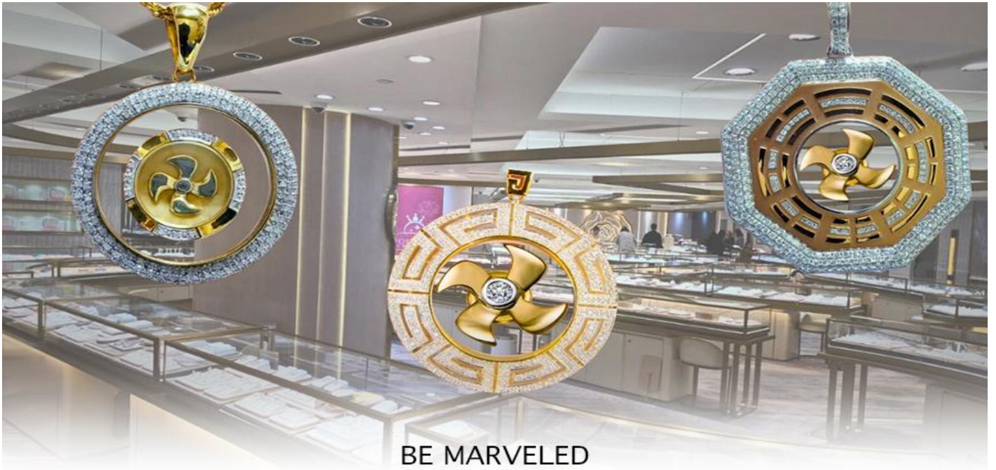
BE MARVELED ศูนย์ฮวงจุ้ย กังหันเศรษฐี

นำท่านชม ศูนย์ฮวงจุ้ย กังหันเศรษฐี ที่ขึ้นชื่อของฮ่องกง ท่านจะได้พบกับงานดีไซน์ที่ได้รับรางวัลยอดเยี่ยม และใช้ในการเสริมดวงเรื่องฮวงจุ้ย โดยการย่อใบพัดของกังหันที่เป็นสัญลักษณ์ของวัดวัดเซ่งจี้มาทำเป็นเครื่องประดับ ไม่ว่าจะเป็นจี้, แหวน, กำไล หรือต่างหูเพื่อเป็นเครื่องประดับติดตัว และเสริมดวงชะตา ซึ่งสินค้าทุกชิ้น มีเอกสาร รับประกันคุณภาพเปลี่ยนหรือซ่อม ได้ตลอดอายุการใช้งาน หากเกิดการชำรุดจากสินค้าไม่ใช่อุบัติเหตุ