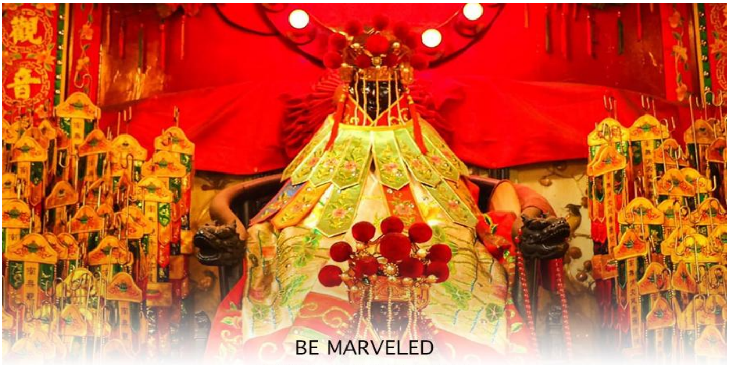
BE MARVELED วัดเจ้าแม่กวนอิมสองอำ (ยิมฮิน)

จากนั้นนำท่านสู่ เจ้าแม่กวนอิม วัดสองอำ (HUNG HOM KWUN YUM TEMPLE) เป็นหนึ่งในวัดที่เก่าแก่ที่สุดของฮ่องกง และชาวฮ่องกงเลื่อมใสศรัทธามาก สร้างขึ้นในปี ค.ศ.1873 ในสมัยช่วงสงครามโลกครั้งที่ 2 มีการปล่อยระเบิดลงบริเวณใกล้กับวัดแห่งนี้หลายต่อหลายครั้ง ทำให้มีผู้บาดเจ็บและล้มตายมากมาย แต่ชาวบ้านที่หนีเข้าไปหลบภัยในวัดนี้ก็กลับปลอดภัยอย่างปาฏิหาริย์ และตัววัดก็ไม่ได้รับความเสียหายจากเหตุการณ์ทิ้งระเบิดที่น่าอัศจรรย์ ตามความเชื่อของคนจีนใน ฮ่องกง-มาเก๊า จะมี "วันเปิดทรัพย์" หรือ "พิธียืมเงิน เจ้าแม่กวนอิมฮ่องกง" เป็นวันที่จะมาขอพรและยืมเงินเจ้าแม่กวนอิม ซึ่งนับจากหลังวันตรุษจีน ไป 26 วัน จะเป็นวันเปิดทรัพย์ที่จัดขึ้นในทุกๆปี พิธีนี้จะมีเพียงครั้งปีละครั้งเท่านั้น เป็นวันสำคัญอีกวันที่คนหลังไหลมาไหว้ขอพรอย่างไม่ขาดสาย