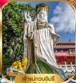
เจ้าแม่กวนอิม พลัสเบย์