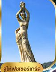
จูไห่ฟิชเชอร์ทิวรี่