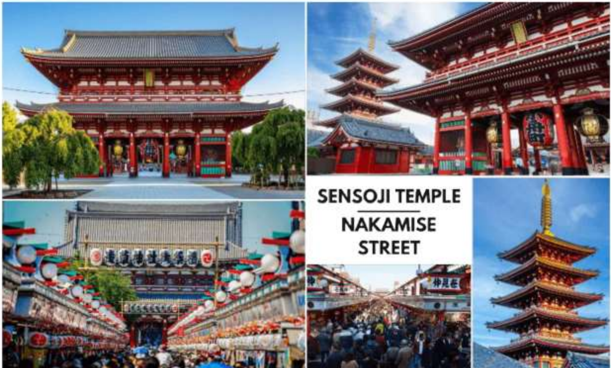
รูปภาพใช้เพื่อประกอบการโฆษณาเท่านั้น

คณะเดินทางถึง สนามบินนานาชาตินาริตะ ประเทศญี่ปุ่น ( เวลาที่ประเทศญี่ปุ่นจะเรียกว่าประเทศไทย 2 ชม. ควรปรับนาฬิกาของท่านเพื่อสะดวกในการนัดหมาย ) หลังผ่านพิธีตรวจคนเข้าเมืองแล้ว จากนั้นนำท่านสู่ เมืองโตเกียว (Tokyo) มหานครที่ใหญ่ที่สุดแห่งหนึ่งของเอเชีย และของโลก ประกอบด้วยแหล่งท่องเที่ยว แหล่งวัฒนธรรม ศูนย์รวมเศรษฐกิจ เทคโนโลยีทางด้านต่าง ๆ และสถานที่สำคัญทางศาสนา มากมายในมหานครแห่งนี้ที่ผสมผสานกันได้อย่างลงตัว นำท่านเดินทางสู่ วัดเซ็นโซจิ (Sensoji Temple) หรือที่รู้จักกันในนาม วัดอาซากุสะ เป็นวัดที่ขึ้นชื่อว่าเก่าแก่มากที่สุดของเมืองโตเกียวแห่งนี้ ถูกสร้างขึ้นเสร็จเมื่อประมาณปี ค.ศ. 645 เป็นหนึ่งในวัดที่เก่าแก่ และเป็นที่ยอมรับมากที่สุดวัดหนึ่งของเมืองโตเกียว บริเวณทางด้านหน้าวัดจะมี ถนนนากามิเสะ (Nakamise) เป็นถนนยาวเข้าสู่พื้นที่ภายในวัด เต็มไปด้วยร้านค้า ร้านอาหาร ร้านจำหน่ายของที่ระลึกต่าง ๆ มากมาย โดยนักท่องเที่ยวนิยมถ่ายภาพที่ระลึกกับโดมแดงอันใหญ่ ๆ ที่เปรียบเสมือนสัญลักษณ์สำคัญมาก ๆ ของวัดแห่งนี้ ให้ท่านได้ช้อปปิ้งเลือกซื้อสินค้าของขวัญของฝากจากญี่ปุ่น หรือเลือกซื้อเลือกชิมขนมท้องถิ่นอร่อย ๆ มากมายตามได้บรรยากาศ