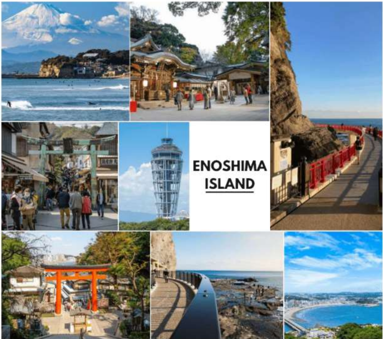
รูปภาพใช้เพื่อประกอบการโฆษณาเท่านั้น

ประภาคารชมวิว เอนะชิมะซีแคนเดิล (Enoshima Sea Candle) หอประภาคารสังเกตการณ์ที่คุณสามารถขึ้นไปชมทิวทัศน์รอบทิศสุดตระการตาได้ ด้วยความสูงจากพื้น 100 เมตร ทำให้มองเห็นทิวทัศน์ทั้งงดงาม และไกล ๆ กับประภาคารมีส่วนพฤกษศาสตร์ ซามูเอล ค็อกกิง (Samuel Cocking Garden) เป็นส่วนที่เต็มไปด้วยดอกไม้หลากหลายสายพันธุ์ตามฤดูกาล อาทิ พืชพันธุ์ของมหาสมุทรแปซิฟิกทางตอนใต้ และมีการจัดแสดงไฟในช่วงเวลากลางคืนอีกด้วย (ราตาทัวร์ไม่รวมค่าเข้าชม), ถ้ำเอนะชิมะ อิวายะ (Enoshima Iwaya Cave) ที่อยู่ด้านหลังเกาะเอนะชิมะ ตรงปลายสุดของทางเดินเลียบชายฝั่ง เป็นถ้ำธรรมชาติที่เกิดจากการกัดเซาะของคลื่นทะเลเป็นเวลานานหลายปี ในยุคเอโดะเชื่อกันว่าเคยเป็นสถานที่ที่ศักดิ์สิทธิ์ที่มีผู้คนมากมายมาสักการะ ว่ากันว่าหลังจากภูเขาฟูจิถูกส่งตรงมายังถ้ำแห่งนี้ เมื่อเดินพันตัวถ้ำ จะพบกับลานหินผาที่เรียกว่า ชิโกกะฟูจิ (Chigogafuchi) ซึ่งสามารถชมพระอาทิตย์ตกดินกับภูเขาไฟฟูจิทั้งงดงามจนเกินบรรยาย (ราตาทัวร์ไม่รวมค่าเข้าชม) ใช้เวลาเดินทางประมาณ 1 ชั่วโมง