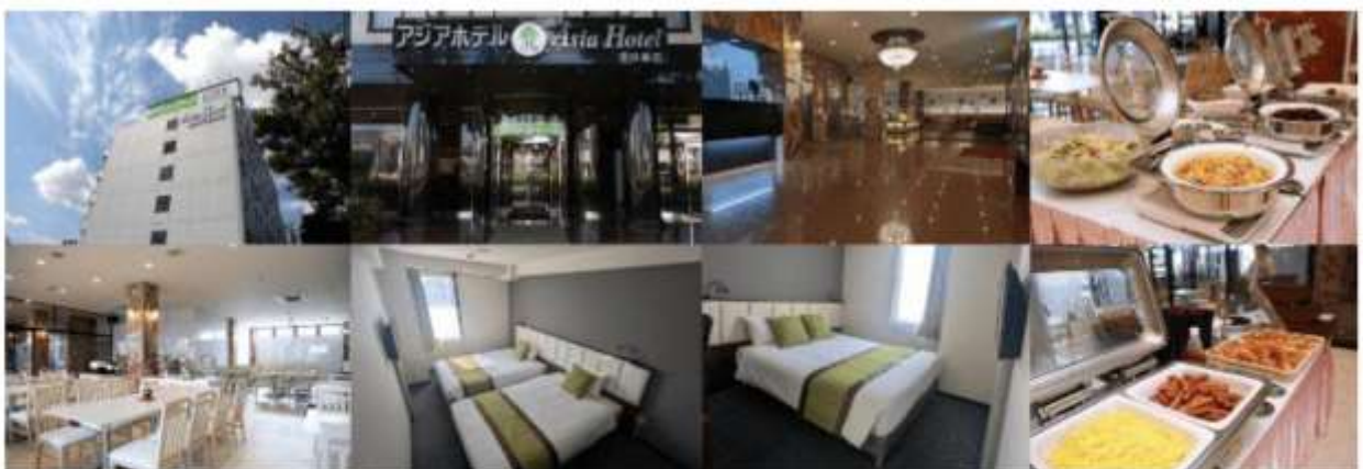
รูปภาพใช้เพื่อประกอบการโฆษณาเท่านั้น