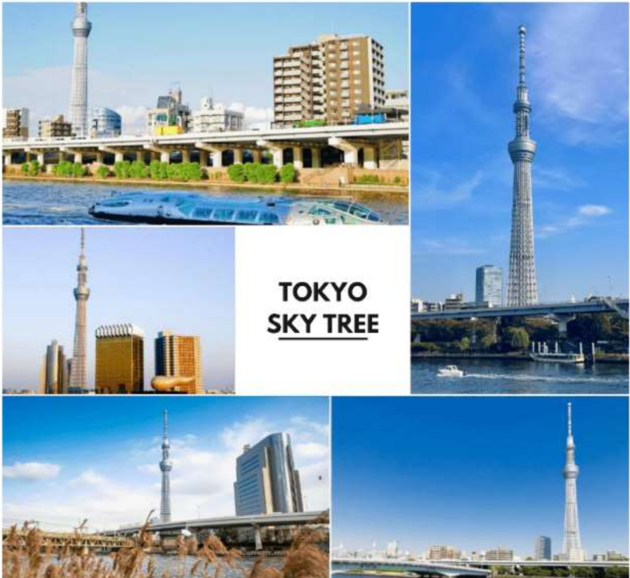
รูปภาพใช้เพื่อประกอบการโฆษณาเท่านั้น

จากนั้นนำท่านแวะ ถ่ายรูปหอคอยโตเกียวสกายทรี (Tokyo Sky Tree) ริมน้ำสุมิเดะ (Sumida River) หอคอยที่สูงที่สุดในโลก จัดเป็นแลนด์มาร์คอีกอย่างหนึ่งของกรุงโตเกียวบริเวณริมน้ำสุมิเดะ เป็นหอส่งสัญญาณโทรทัศน์ขนาดมที่สูงที่สุดในโลก อีสาระให้ท่านเก็บภาพตามอัธยาศัย ทิวทัศน์ของหอคอยโตเกียวสกายทรี สามารถมองเห็นได้จากทะเลอ่าวโตเกียว ชากุสะที่เต็มไปด้วยกลิ่นอายแบบเมืองเก่าของเอโดะ ( ราคาทัวร์ไม่รวมค่าขึ้นหอคอย ) ซึ่งริมน้ำสุมิเดะนั้น ท่านสามารถเก็บภาพความประทับใจกับความสวยงามของวิวเมืองที่เต็มไปด้วยตึกระฟ้าที่มีหอคอยสูงตระหง่านตามอัธยาศัย