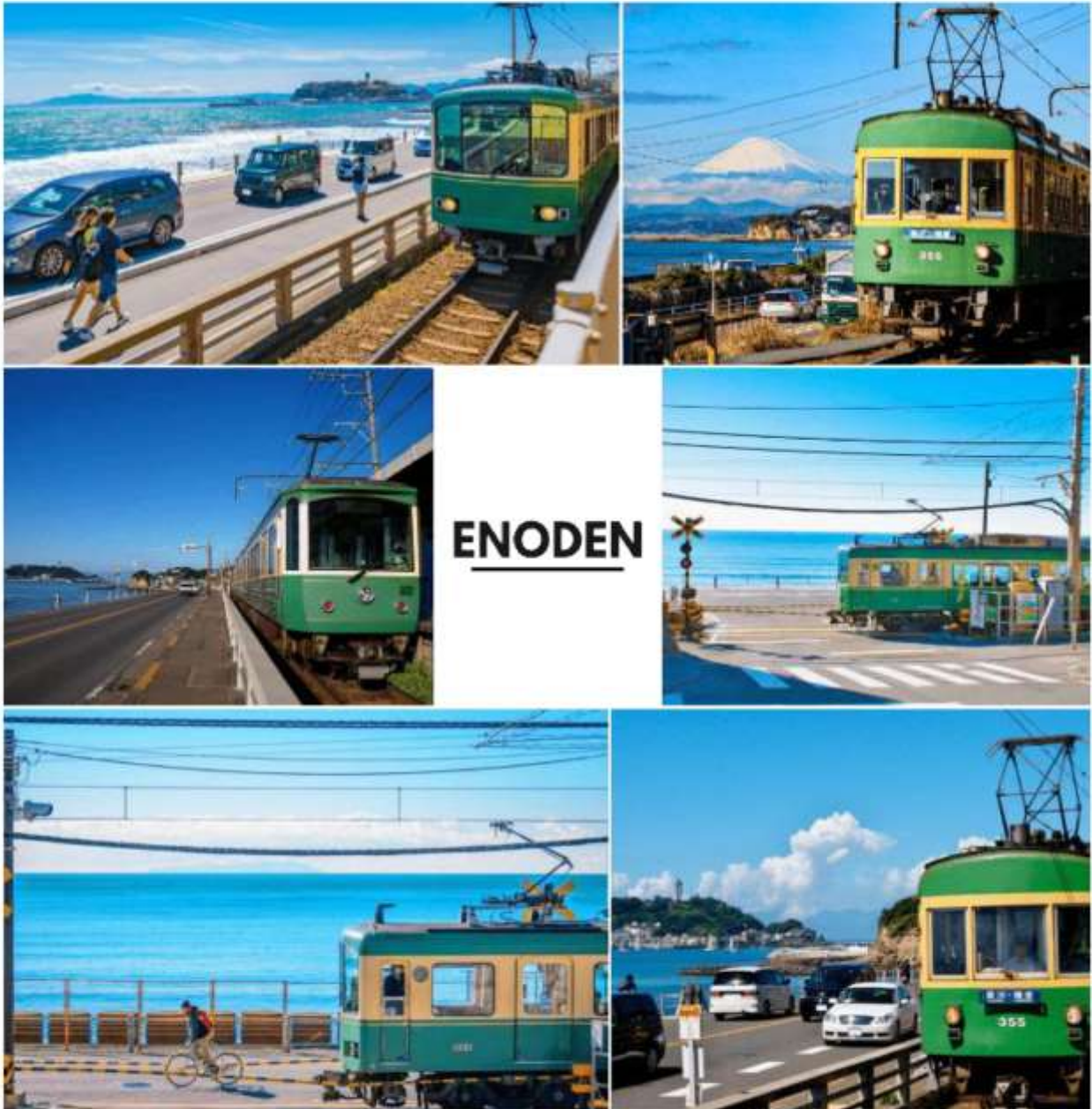
รูปภาพใช้เพื่อประกอบการโฆษณาเท่านั้น

จากนั้นนำท่าน นั่งรถไฟสาย ENODEN จากสถานี ENOSHIMA สู่สถานี HASE สัมผัสเสน่ห์ที่สุดคลาสสิกรถไฟสีเขียว-เหลืองในตำนาน Enoden Line เส้นทางที่สวยงามที่สุดในคามาคุระ พาท่านเดินทางย้อนเวลาจากสถานี Enoshima สู่สถานี Hase บนเส้นทางที่รถไฟจะวิ่งผ่านบ้านเรือนเก่าแก่ และเลียบชายหาดกว้างไกล ให้ท่านได้ชมวิถีทะเลสีครามแบบพาโนรามาผ่านหน้าต่างรถไฟ โดยไฮไลท์ คือ ท่านจะนั่งผ่านจุดถ่ายรูปรายอดนิยม ที่โด่งดังมาจากอนิเมะ เช่น Slam Dunk และภาพยนตร์ญี่ปุ่นอีกหลายเรื่อง ถือเป็นสถานที่ยอดฮิตที่ห้ามพลาดเมื่อมาเยือนคามาคุระ