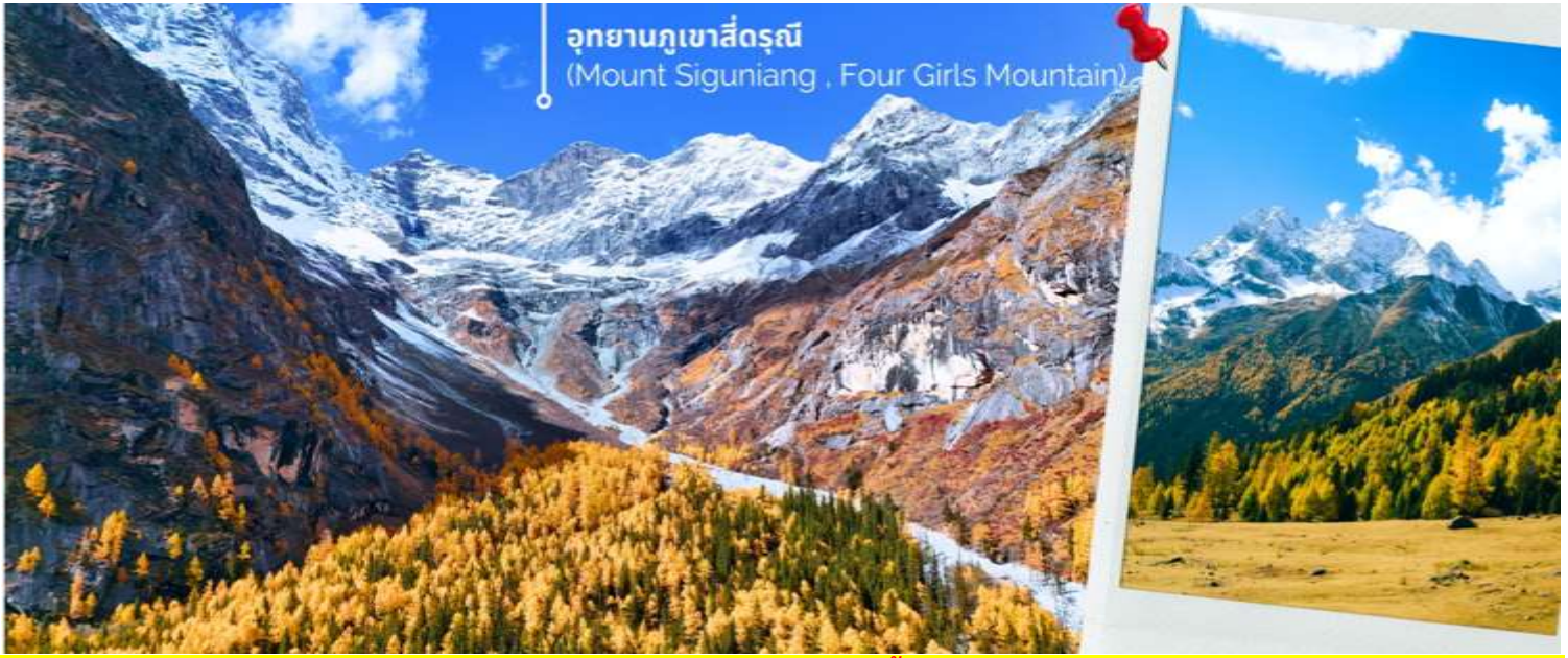
อุทยานภูเขาสี่ดรุณี (Mount Siguniang , Four Girls Mountain)

มัทรีมา ผสมผสานกับป่าไม้เขียวขจีราวกับดินแดนสวรรค์ ส่วนบริเวณใกล้เคียงยังเป็นที่ตั้งของหมู่บ้านชาวทิเบตที่มีวิถีชีวิตเรียบง่าย อีกจุดที่ควรค่าแก่การเข้าไปเยี่ยมชม สัมผัสวิถีแบบดั้งเดิมอย่างใกล้ชิด