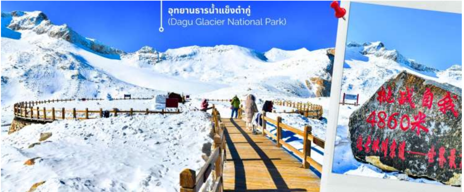
การตกและความหนาวของหิมะขึ้นอยู่กับสภาพอากาศ