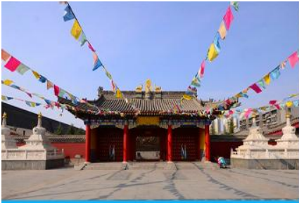
วัดลามะกว้างเหริน