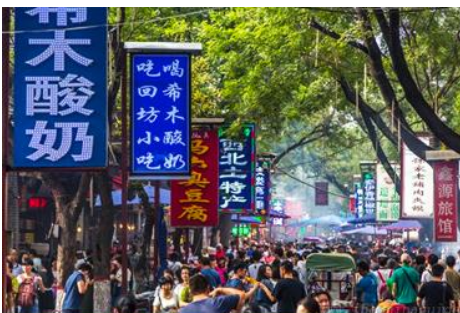
ตลาดมุสลิม