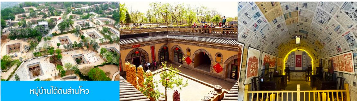
หมู่บ้านใต้ดินสามโจว

หลังอาหารนำท่านเดินทางสู่ เมืองซานเหมินเกีย 三门峡 (ระยะทาง 149 กม ใช้เวลาเดินทางราว 2 ชั่วโมง)