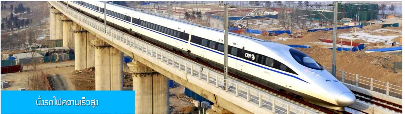
บริการรถไฟความเร็วสูง

หลังอาหารนำท่านเดินทางสู่สถานีรถไฟความเร็วสูงนครซีอาน เพื่อเตรียมเดินทางสู่นครฉวี่หยาง