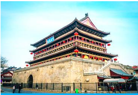
จัตุรัสหอกลอง