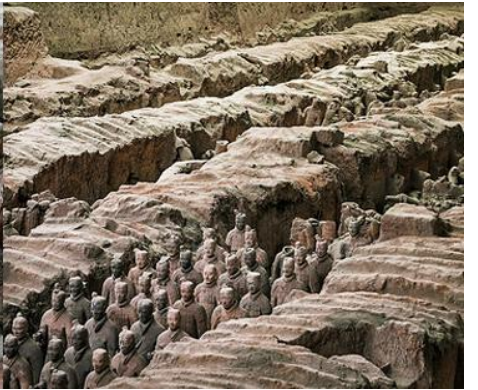
สุสานกองทัพทหารม้าจีน