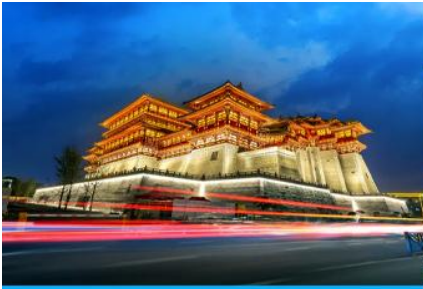
นครลั่วหยาง