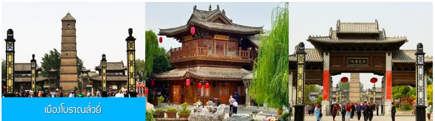
เมืองโบราณฉวี่หยาง

16.18 น. ขบวนรถไฟนำคณะเดินทางถึงสถานีรถไฟนครฉวี่หยาง นำคณะขึ้นรถบัสเพื่อเดินทางสู่ นครฉวี่หยาง