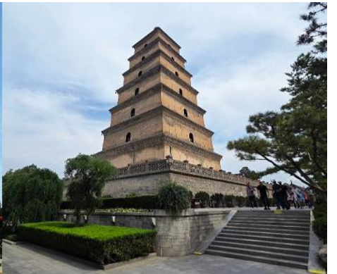
เจดีย์ห้าบาใหญ่

หลังอาหารนำท่านเดินทางสู่ นครซีอาน (ระยะทาง 50 กม ใช้เวลาเดินทางราว 1 ชั่วโมง) นำท่านชม เจดีย์ห้าบาใหญ่ 大雁塔 เจดีย์โบราณนี้เป็นแลนด์มาร์คที่โดดเด่นของนครซีอาน ตั้งอยู่ทางทิศใต้ของกำแพงเมืองซีอาน เป็นโบราณที่มีความสำคัญทางศาสนา ที่แสดงถึงความรุ่งเรืองของพุทธศาสนาในแผ่นดินจีน หลังจากที่พระถังซำจั๋งเดินทางไปยังชมพูทวีปเพื่ออัญเชิญพระไตรปิฎกกลับมายังแผ่นดินจีน ท่านก็ได้พำนักที่วัดต้าเจียนและเป็นเจ้าอาวาสของวัดนี้ จากนั้นได้มีการสร้างเจดีย์ 5 ชั้นเพื่อใช้ในการเก็บรักษาพระไตรปิฎกที่