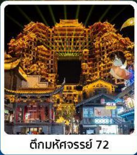
ตึกมหัศจรรย์ 72