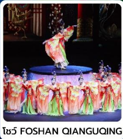
โชว์ FOSHAN QIANGQING