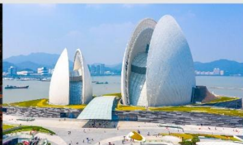
โรงละครหอยไข่มุก