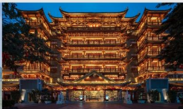
วัดต้าฝอซื่อ