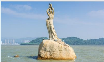
จูไห่พีชเชอร์เกิร์ล(หวีหนี่)