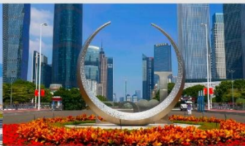
จัตุรัสฮัวเจิง

*ทางบริษัทฯ ขอสงวนสิทธิ์ในการสลับโปรแกรมทัวร์ตามความเหมาะสมขึ้นอยู่กับสถานการณ์หน้างาน โดยคำนึงถึงผลประโยชน์ของลูกค้าเป็นสำคัญ