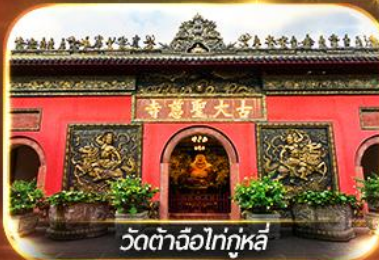
วัดต้าจื่อไท่กุหลี่