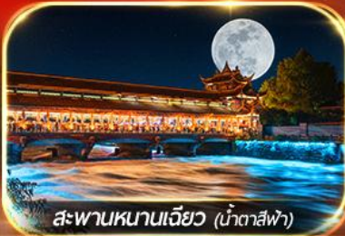
สะพานหนานเจียว (น้ำตาสีฟ้า)