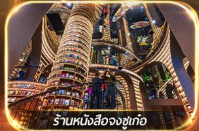
ร้านหนังสือจงซูเท่อ

เที่ยวชมทัศนียภาพ 2 อุทยาน ปี้เฟิงโก & ชวงเจียวโก