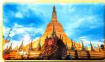
เจดีย์ชเวอดอร์